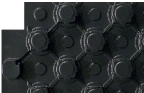
Placa de nopas 27 Térmica Stark