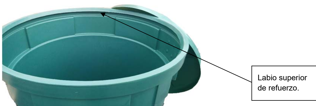
Figura 2 Estructura de refuerzo en la apertura

El diseño del labio superior en la boca del depósito aporta resistencia y robustez, evitando posibles alteraciones y deformaciones. (fig.2).