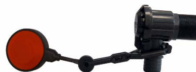
Figura 3 Regulador de nivel mecánico

Taladrar el depósito con una broca de diámetro 2 mm superior al de la rosca del regulador de nivel. La rosca del regulador de nivel debe quedar horizontal (no taladrar en la parte curva del depósito).