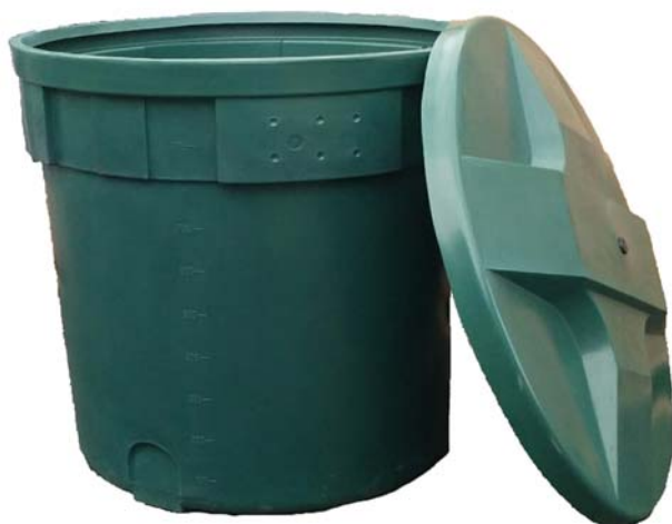
Figura 1 Depósito y tapa. Las flechas indican las zonas planas aptas para montar los accesorios